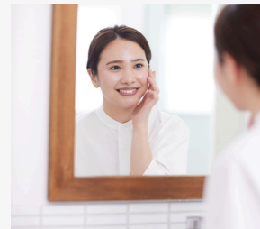
自分との 向き合い方