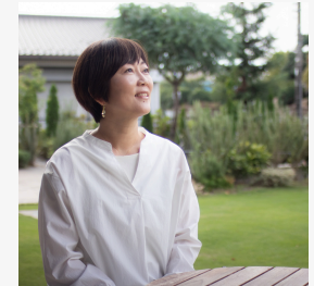
人生を丁寧に生きる 『自優力』