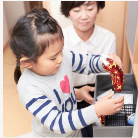
おかたづけの基本