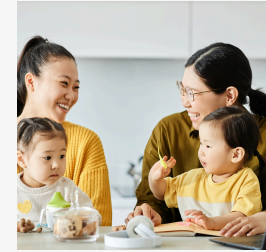
ママの心を整える 子育て相談