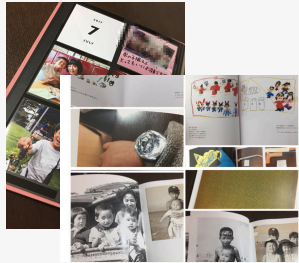
写真・思い出整理